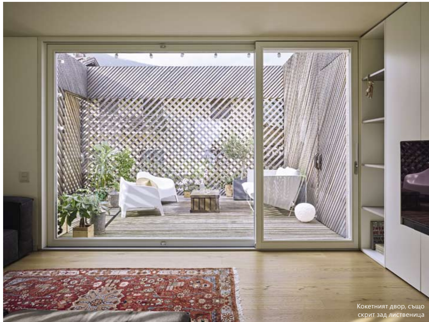
Кокетният двор, също скрит зад ливница