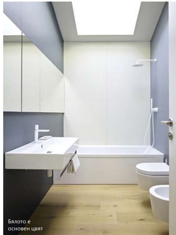
Бялото е основен цвят