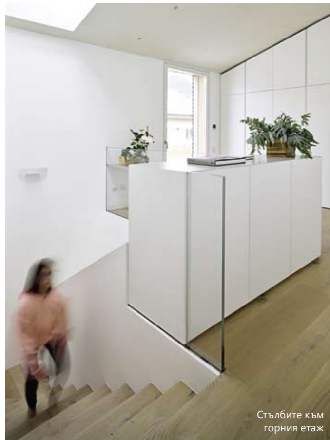
Стълбите към горния етаж