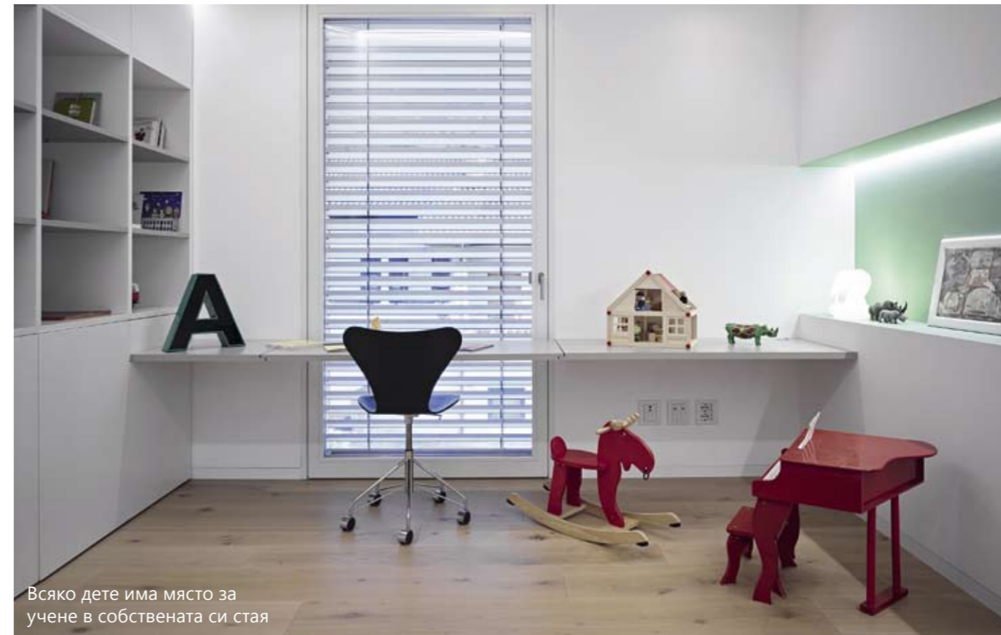
Всяко дете има място за учене в собствената си стая