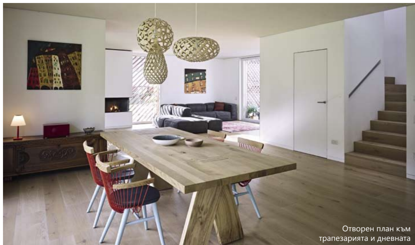
Отворен план към трапезарията и дневната

рен план и с достатъчно пространство, за да събере роднини, особено в зоната, където е меката мебел. Тази част на къщата представлява интересна смесица от характер и стил. Погледът само към кухнята създава усещане за ултрамодерност чрез решението изцяло в бяло, строгите форми и модулните мебели, които скриват почти цялата техника. Точно отсреща обаче са трапезарията и дневната, в които атмосферата е различна и напомняща на тази в селските къщи – заради камината, красивата дървена маса, лампите и картините.