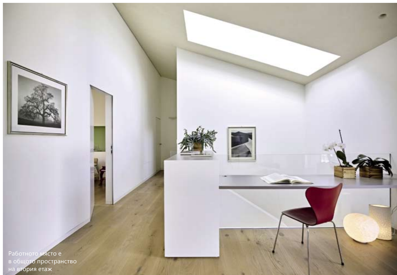
Работното място е в общото пространство на втория етаж

пактни. До голяма степен внушението е резултат и от използването и там на бялото като основен цвят. Мебелите за цялата къща са проектирани от Бурнаци и Фелтрин, които по поръчка на собствениците са вградили част от осветлението именно в мебелите. На двускатния покрив са поставени слънчеви и фотоволтаични панели. Разположени са така, че да следват наклона за минимално визуално въздействие върху общата ековизия. Именно на това е посветено и решението парпетите на обширните тераси на втория етаж да са стъклени. Така те остават почти невидими и не скриват нищо от ефектната облицовка от дърво.